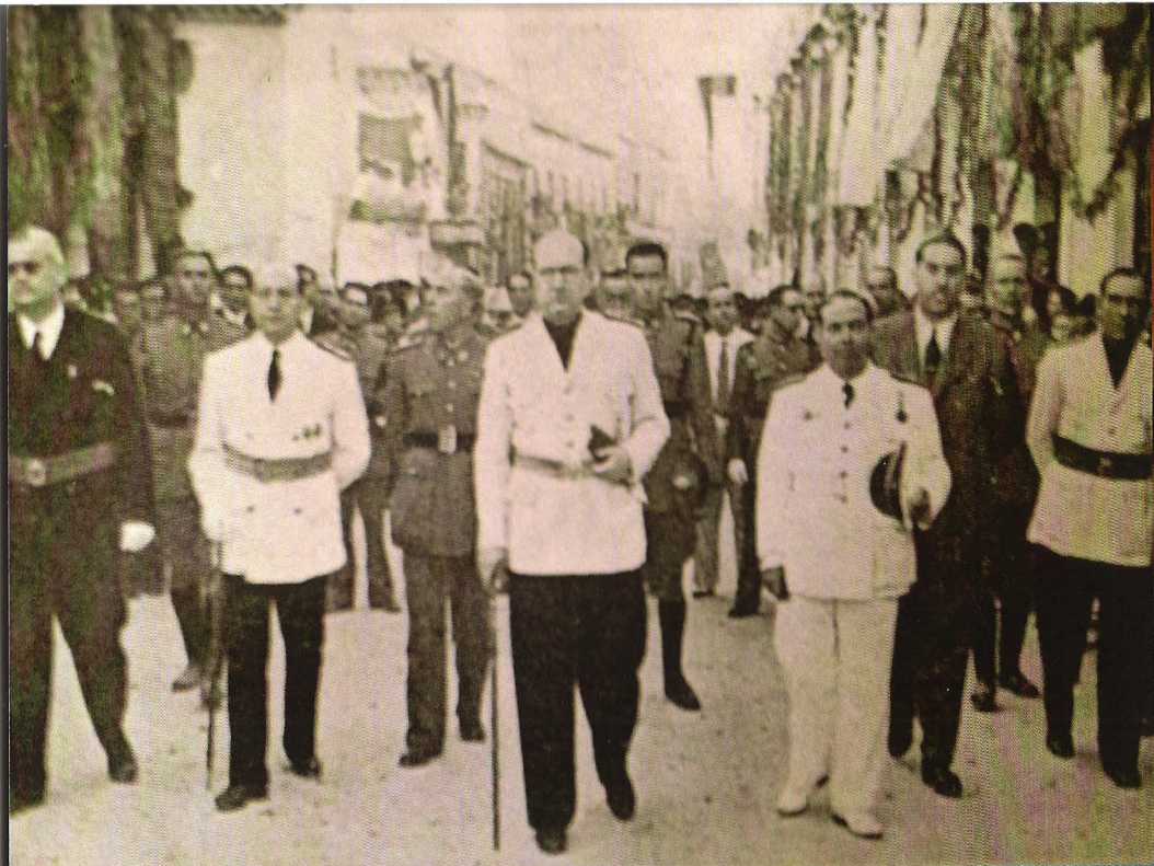
Nuestro Excmo. Sr. Gobernador Civil y autoridades provinciales en la presidencia oficial de la Solemne Procesión