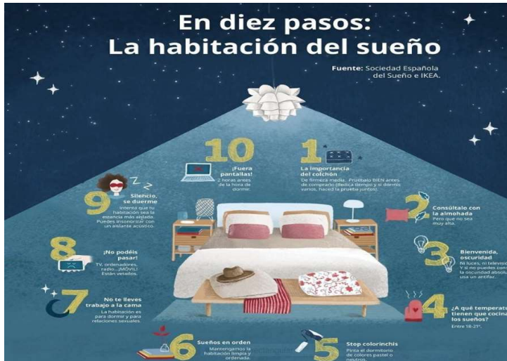
Fuente: Sociedad Española del Sueño & Ikea

“La cama es nuestro taller de descanso, el lugar donde el cuerpo se recupera y la mente se reinicia. Un ambiente tranquilo y libre de distracciones convierte este espacio en un verdadero oasis para un sueño profundo y reparador”