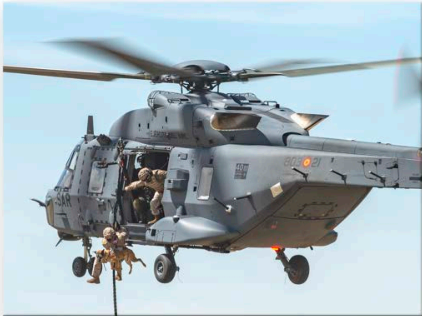
"Canis Lupus_01. NH90 Fastropo Perro"