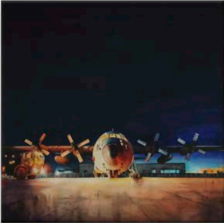
"No hay descanso" Gracia Chicharro Valencia Acuarela, 100 x 100