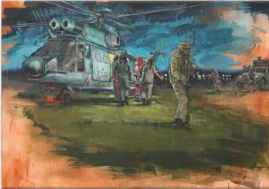
"Trabajo en equipo"