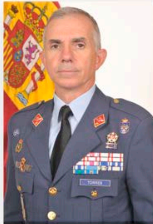
General de División Fernando Torres San José

Gran impulsor de la práctica deportiva en el seno del Ejército del Aire y del Espacio, ha destacado por su entrega, entusiasmo, constancia, afán de superación, nobleza en la lucha y deportividad en la que siempre ha dicho que “lo que importa es el equipo” abanderando en el ámbito deportivo uno de los valores esenciales de nuestra institución.