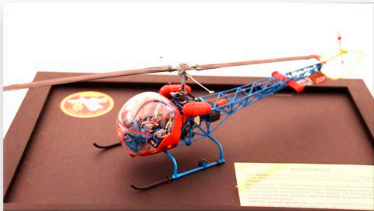
JAVIER SANCHO SIFRE "Augusta Bell 47"