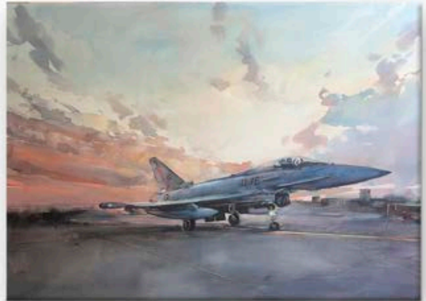
"Una nueva misión"

Acuarela sobre papel Arches de algodón , 110 x 160