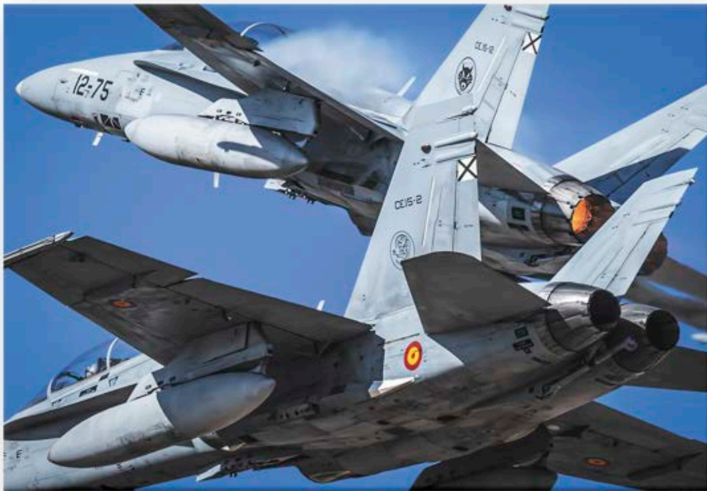
"C.15 en acción_06"