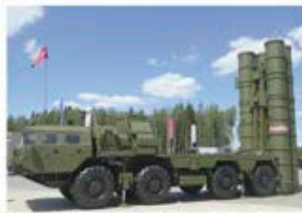
Sistema antiaéreo S-400 (Turk) S-27 en demostración

El primer de los retos que se debe considerar es de carácter doctrinal y organizativo. La SEAD es según la NATO SEAD Policy un elemento integral y conjunto en todos los dominios y la aplicación de un planeamiento y dirección conjunta, a nivel operacional, de la campaña SEAD ha demostrado ser enormemente efectiva. Por ejemplo, en la