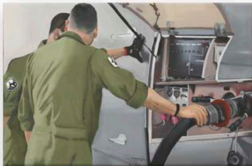
"El aire y el suelo"