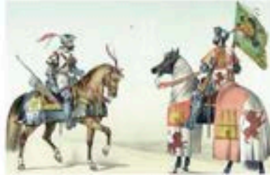
A la izquierda: toreros de España 1932, de Felipe el Hermoso. A la derecha: Guardia Vieja de Castilla de los reyes Católicos (Armas y/o primera época 1493)

Las Guardias Viejas de Castilla, establecidas por los Reyes Católicos en 1493, y posteriormente los Cien Centinos de Carlos I tienen origen en España al nacimiento de la Guardia Real más antigua de Europa y la segunda del mundo, después de la Imperial japonesa.