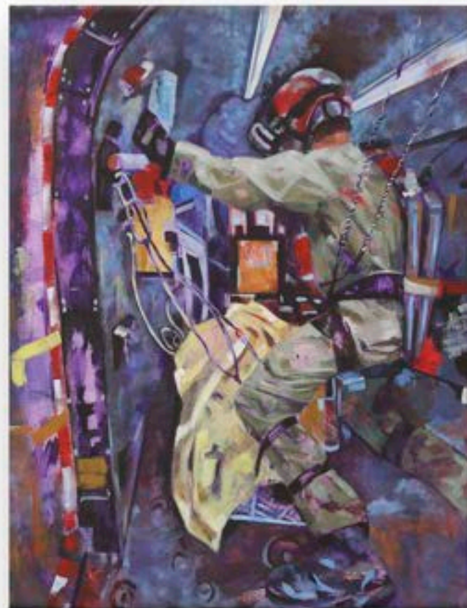
"Siempre en tu ayuda"

Óleo sobre red mimética del Ejército, 100 x 120