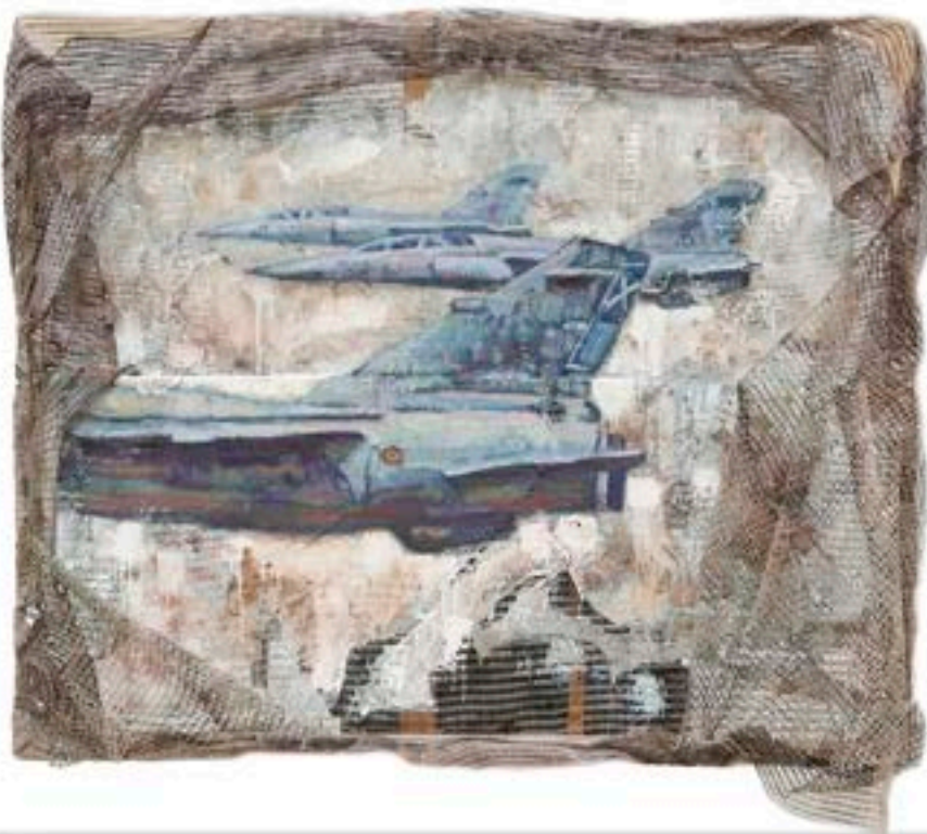
"Red mimética individual"