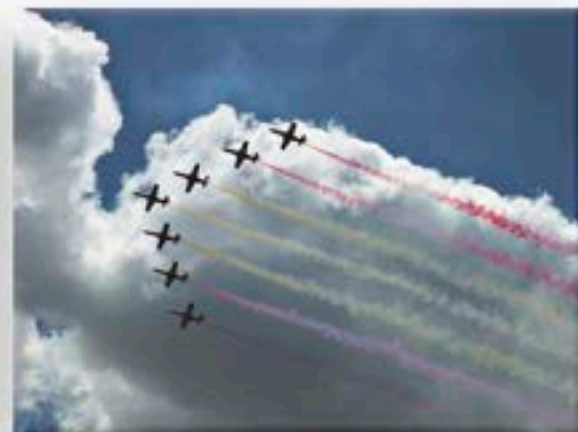
"Estelas (serie 2)"