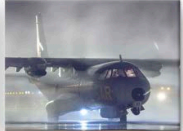
"SAR en el aire"